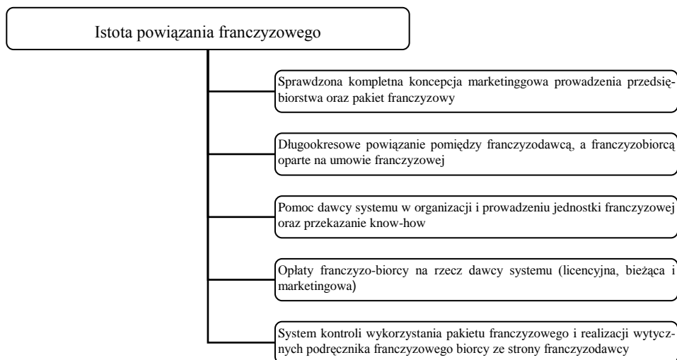
Rys. 1. Istota powiązań franczyzowych

Zwrócić uwagę należy na długotrwałość powiązań franczyzowych. Umowy franczyzowe zawierane są z reguły na 5-10 lat. Wynika to z istoty więzi franczyzowej, która ma sens jedynie przy długotrwałej współpracy i polega na wzajemnym zaufaniu partnerów. Istotę franczyzy przedstawiono na rysunku 1.